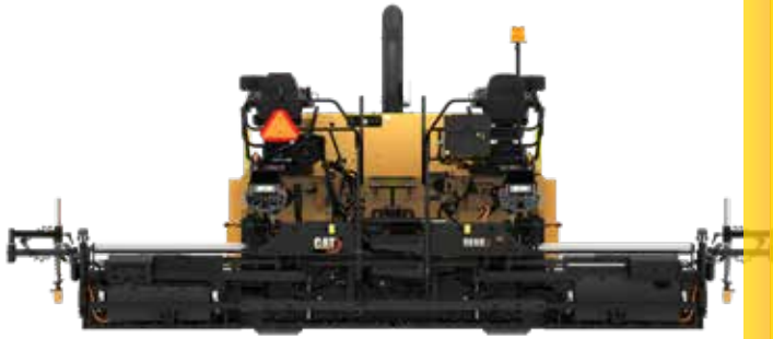
Table de finisseurs SE60 V XW Cat®

La table SE60 V XW Cat® avec rallonges à montage arrière offre de la stabilité, une configuration simplifiée et une plage de pose polyvalente, ce qui fait d'elle la candidate idéale pour les autoroutes, les aéroports et les autres applications de pose de revêtement à haute production.