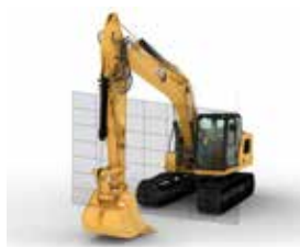
BARRIÈRE ÉLECTRONIQUE PROTECTION DE LA CABINE