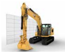
BARRIÈRE ÉLECTRONIQUE EN PIVOTEMENT