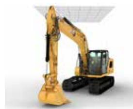
BARRIÈRE ÉLECTRONIQUE PLAFOND