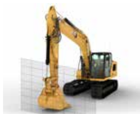
BARRIÈRE ÉLECTRONIQUE VERS L'AVANT