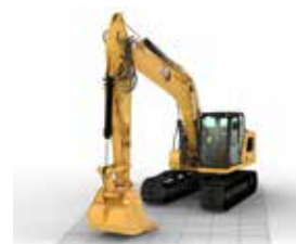
BARRIÈRE ÉLECTRONIQUE SOL