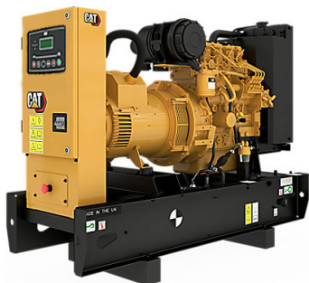
La imagen mostrada podría no reflejar la configuración real