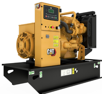
La imagen mostrada podría no reflejar la configuración real