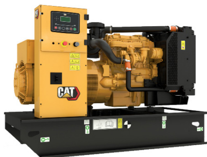
L'illustration peut être différente de la configuration réelle