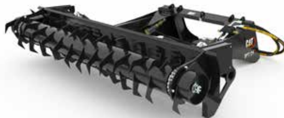
Benna trancia insilato