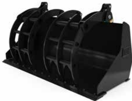
Benna con chiusura idraulica