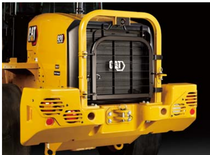
リアドアガードとリアライトガード