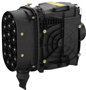
エアクリーナ (フード内吸気)

サイクロン式プレクリーナを新たに装備し、エンジンフィルタへの粉塵の侵入を防ぎます。この革新的なシステムにより、メンテナンスが短時間で、容易になります。