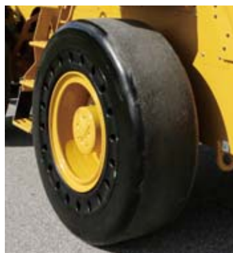
ソリッドタイヤ (スムーズタイプ)