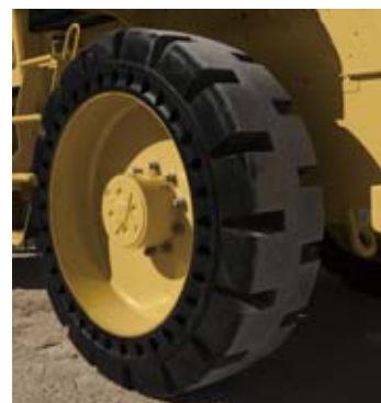
ソリッドタイヤ (トラクションタイプ)