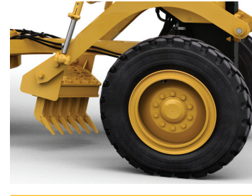
أداة الخدش المعلقة في المنتصف