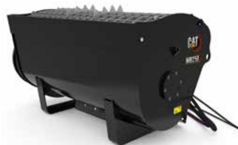
Godet de mélange