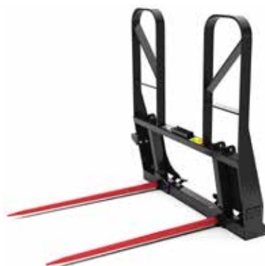
Lance pour balles à deux points