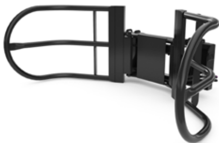
Pince à balles