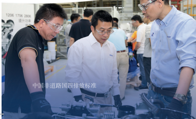
中国非道路国四排放标准

我们拥有世界级的供应链，覆盖 28,000 款原厂零部件，保证能够在最短时间内为您供货。我们的技术人员随时候命，替您维护和维修发动机。我们还成功开发多个创新智能方案，包括 Perkins® 维护室 App (Perkins® My Engine App)，可让您直接通过手机随时取得有关发动机保养、支持和耗件的信息。我们承诺给您悉心照顾，每一步都为您增值。