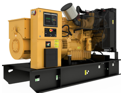
La imagen mostrada podría no reflejar la configuración real.