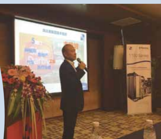
上图：东风井关 T954 拖拉机。 下图：维佳人员在会上作简报。