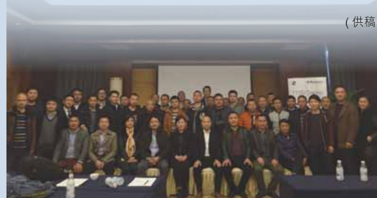
▲ 维佳动力与东风井关携手服务成都农机用户。