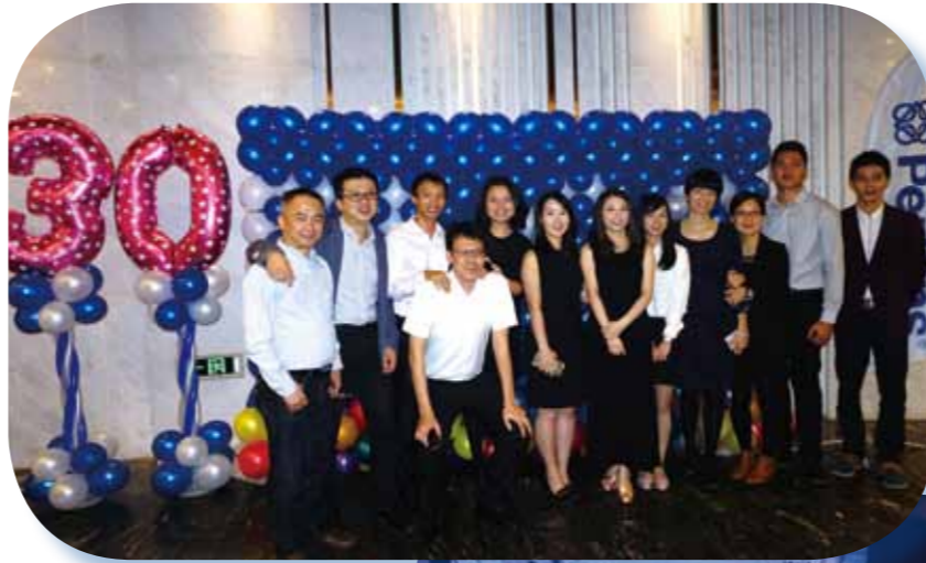
维佳动力员工与客户欢聚一堂，30载风雨同行，不胜感恩。

随着地域的扩展，市场推广的步伐也在跟进。从2011到2016这6年时间里，维佳团队走访了10多个省份，举办了20多场次产品推介会，致力于推介Perkins产品的同时，还不忘加强客户间的合作交流，倾听客户心声，以便把服务做得更臻完善。