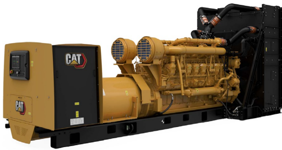
示意图不一定匹配实际配置