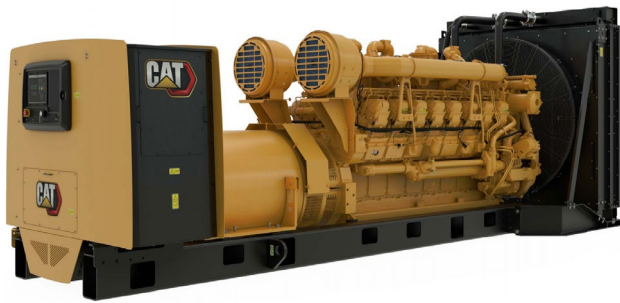
示意图不一定匹配实际配置