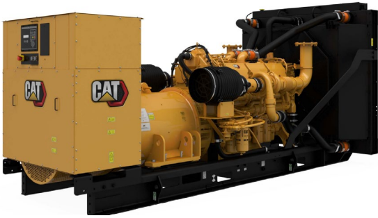
示意图不一定匹配实际配置