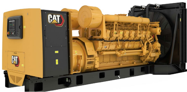
示意图不一定匹配实际配置