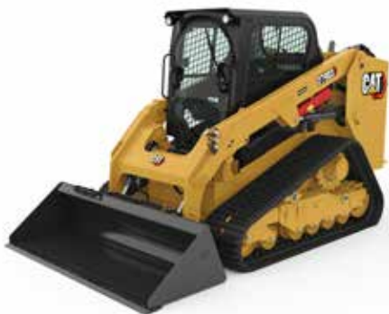
Varillaje de levantamiento radial