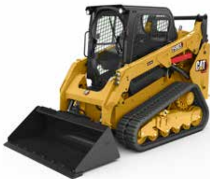
Varillaje de levantamiento vertical