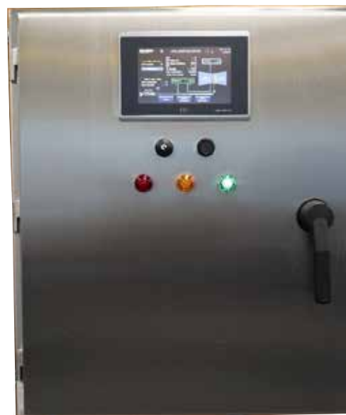
Caja de control del IFM

El IFM incluye también una caja de control (que se puede colocar sobre o fuera de la plataforma de la turbina) con un controlador lógico programable para gestionar el sistema, los módulos de entrada/salida para supervisar y regular el sistema