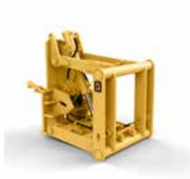
GRUPO DE LEVANTAMIENTO