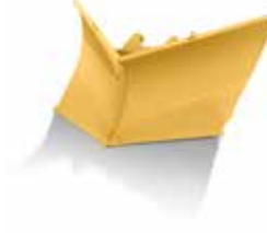
ARADO EN V