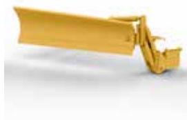
ALA PARA NIEVE SIN MÁSTIL