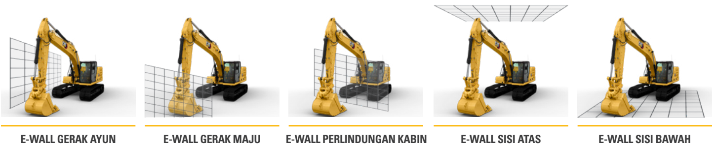
E-WALL GERAK AYUN