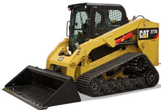
Varillaje de levantamiento radial