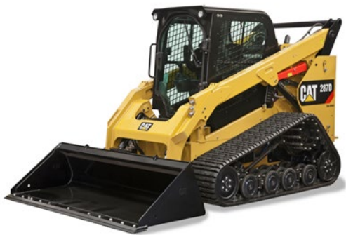
Varillaje de levantamiento vertical