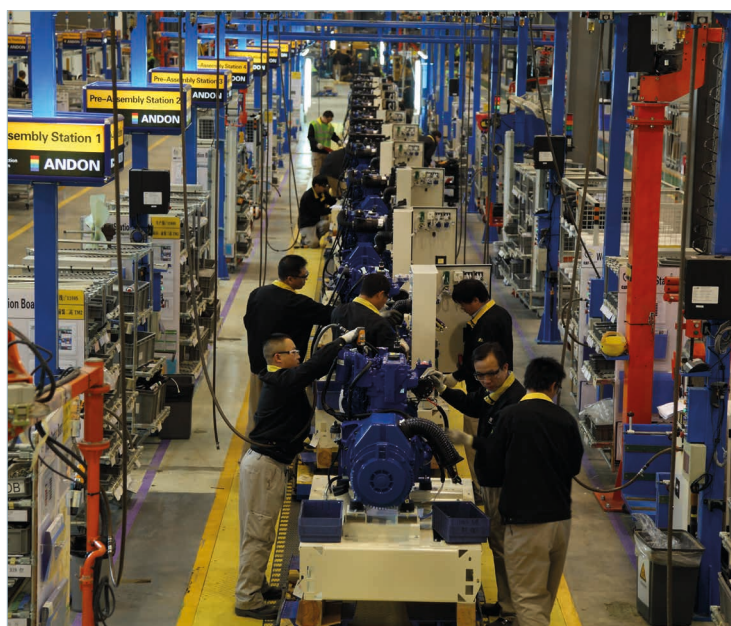
Производственная линия, Китай.

Благодаря нашей системе организации перевозок, охватывающей весь земной шар, и сети распространения продукции, которая включает 370 дилеров в более чем 150 странах, мы обеспечиваем электропитание и поддержку в нужном месте и в нужное время.