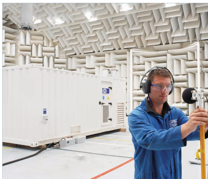
Технический центр передовых технологий, Северная Ирландия.