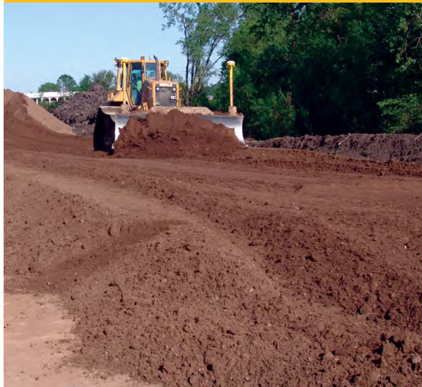
Construction d'une section d'essai.