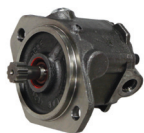
Pompa di mandata del combustibile