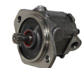
Pompa di mandata del combustibile