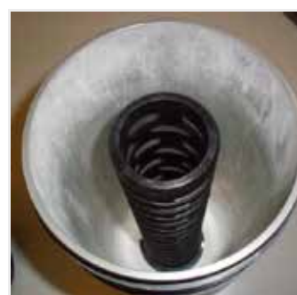
"Kärnlöst" element borttaget från höljet