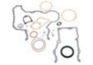
Estructura frontal Juego de juntas y sellos