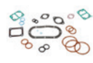
Juego de juntas y sellos para enfriador de aceite y líneas

Selecciona todos los juegos de juntas que necesites.