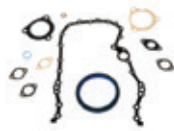
Estructura trasera Juego de juntas y sellos