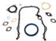
Estructura trasera Juego de juntas y sellos