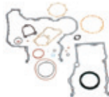
Estructura frontal Juego de juntas y sellos