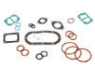
Refroidisseur d'huile et conduites. Kit de garniture et d'étanchéité

Sélectionnez autant de kits de garniture que vous le souhaitez.