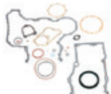
Kit de garniture et kit d'étanchéité Structure avant