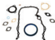
Kit de garniture et d'étanchéité Structure arrière