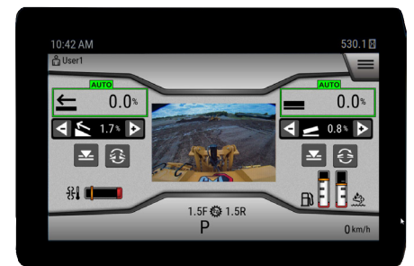
Interface do Operador de Última Geração