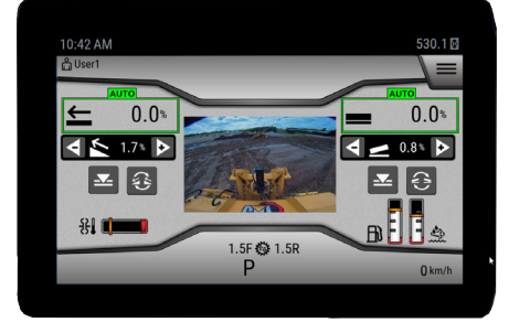
Yeni Nesil Operatör Arayüzü