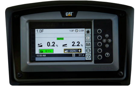
Sıvı Kristal Ekran