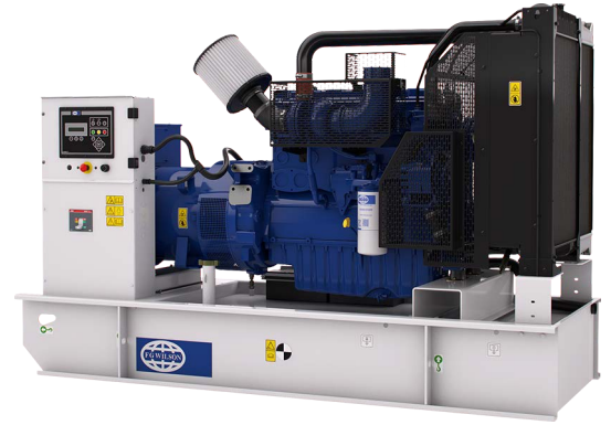
Imagen con finalidad ilustrativa únicamente