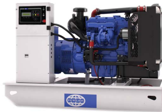
Imagen con finalidad ilustrativa únicamente