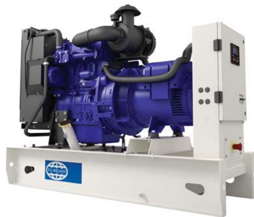
Imagen con finalidad ilustrativa únicamente