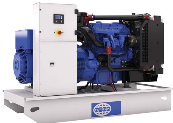
Imagen con finalidad ilustrativa únicamente