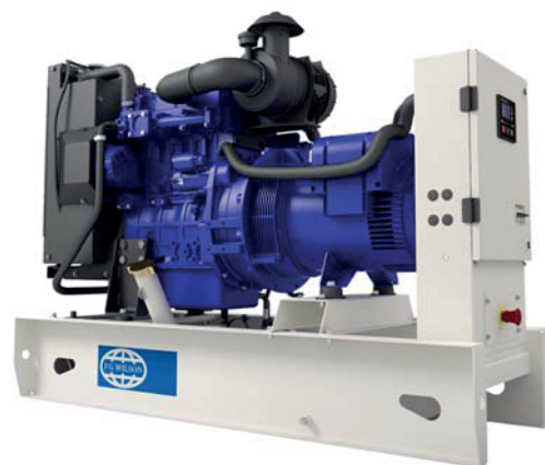
Imagen con finalidad ilustrativa únicamente