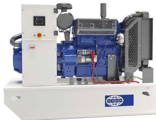
Imagen con finalidad ilustrativa únicamente