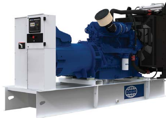
Imagen con finalidad ilustrativa únicamente