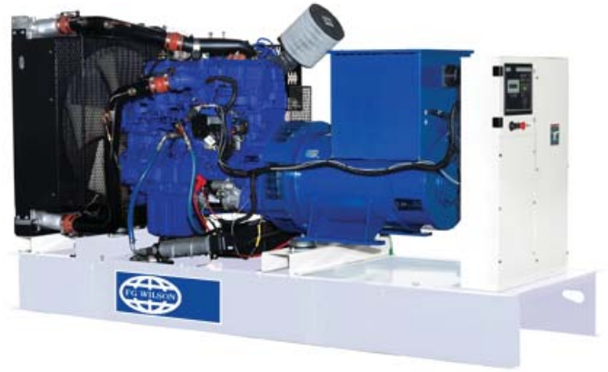
Abbildung dient nur der Illustration.