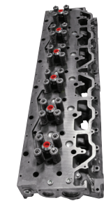
Culata de cilindro