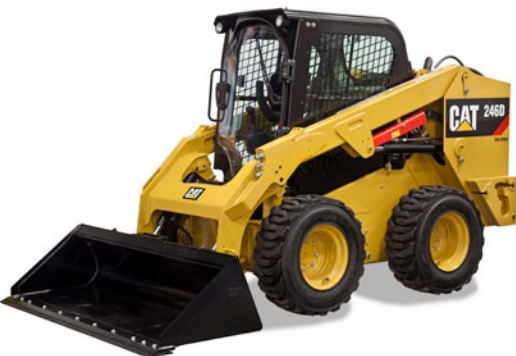
Timonerie à levage radial